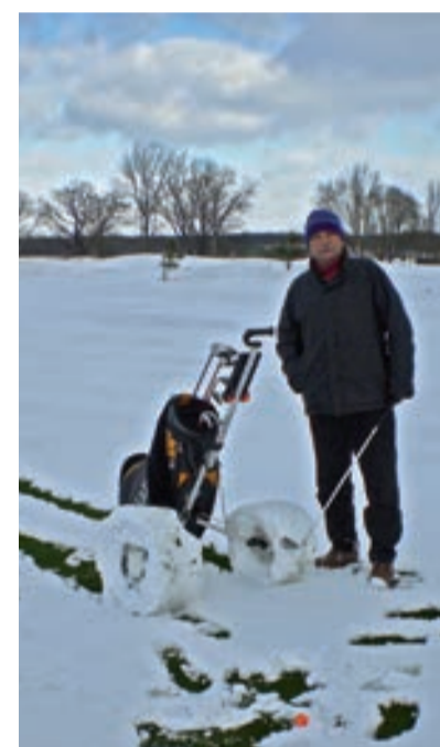
Stará Boleslav v zimě

„Dvanáct hektarů, to byla plocha vhodná jen na public. Dva plánované poloostrovni greeny druhé a deváté jamky, později nasypané do vytěžených jezer, naředily stísněnější poměry. Prostor je využit do krajnosti,“ potvrzuje Velden, že rozšíření hracích ploch k vodě bylo požehnaním.