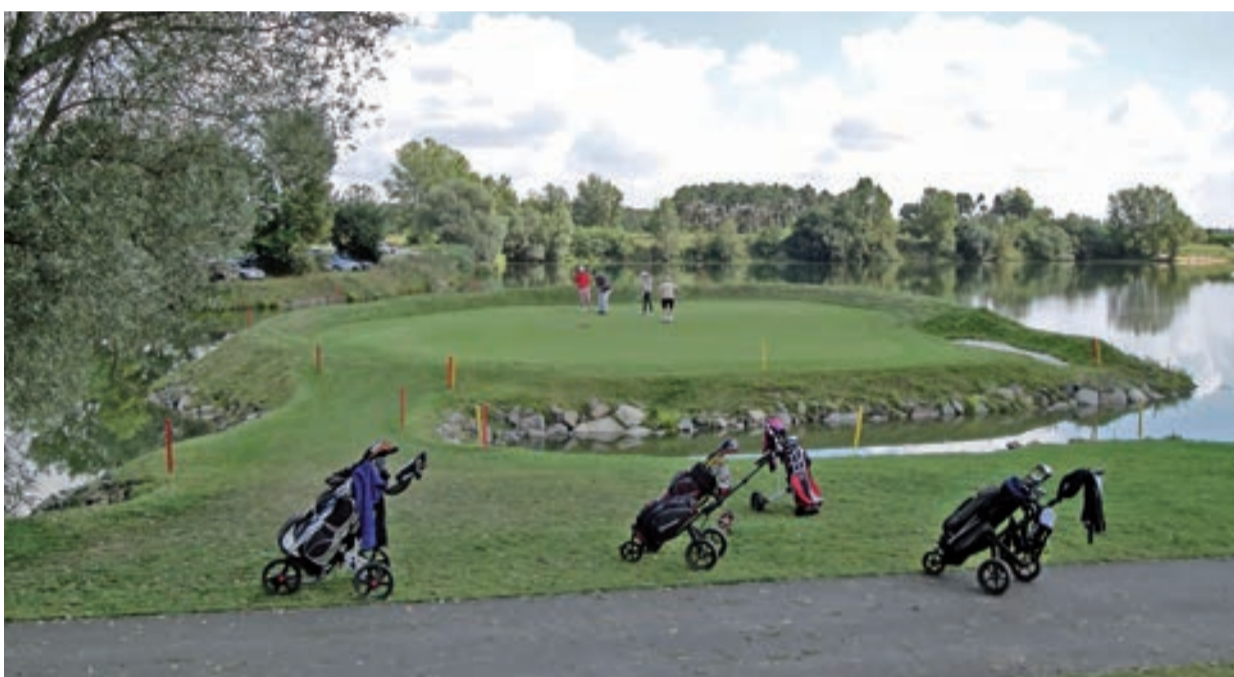
Poloostrovni green deváté jamky

Pojďme však ke stojící devítce, kterou s majitelem Vladimírem Boučkem a shaperem Milanem Iškotkem postavil Velden levně, rychle a bez komplikací.