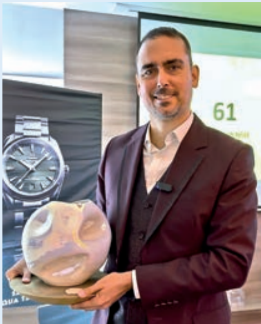
Nejlepší hráči soutěže Golfové stezky