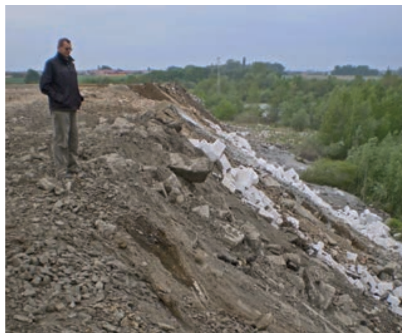
Majitel hřiště na původní skládce