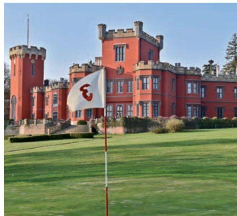
Hrádek u Nechanic

Hřiště se má změnit v louku. „Sekali jsme trávu z peněz členů. Stát na to