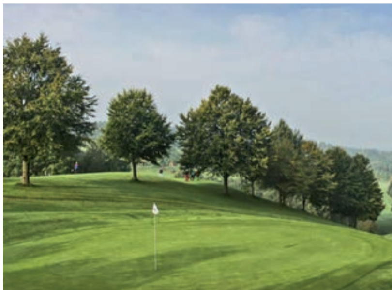
St. Wolfgang Uttlau

St. Wolfgang Uttlau , další dílo Kurta Rossknechta, má par 72 a délku 5818/5074 metrů. Jenže je tu někdy až nevídané převýšení. Hned fairway úvodní jamky vystupuje proti hráči jako sjezdovka a třináctka je natolik strmá, až hrozí uklouznutí. Dobře zapamatovatelné jamky mezi kvetoucími loukami a sady s ovocnými stromy ovšem poskytují nádherné výhledy. Hřiště startuje i končí uprostřed vesnice a na nádvoří statku ze 17. století čeká klubovna i restaurace. Opět je možné hrát i s handicapem 54 a fee začínají na 41 eur. AE