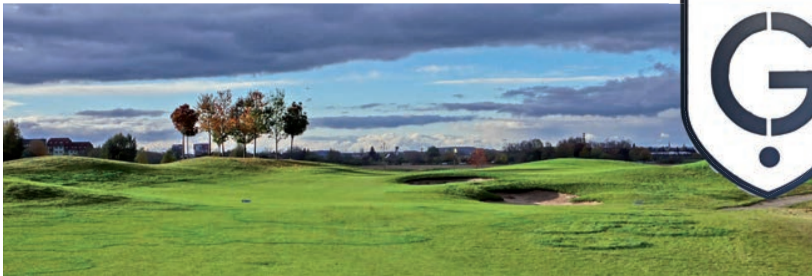
Vinořské hřiště s nádechem linksu